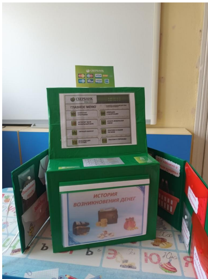
Приложение 3 «Загадки; пословицы; цветок семицветик; семейный бюджет; Куда уходят деньги?; деньги разных стран»